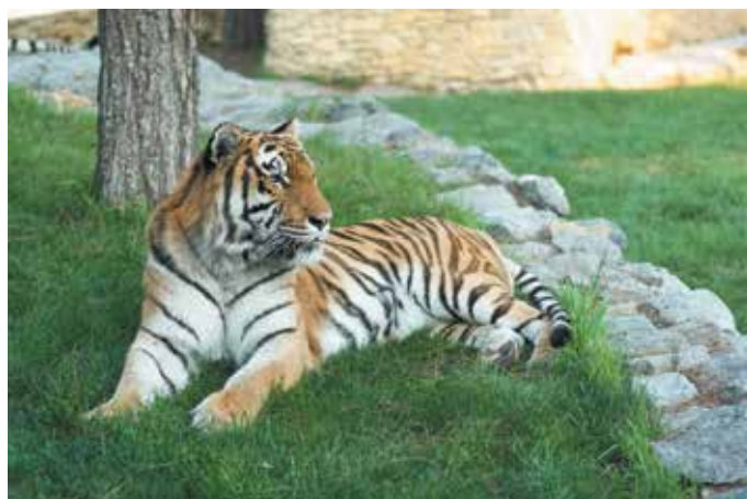
Совместные поездки по интересным местам дарят новые впечатления и сближают всех членов семьи.

Дети будут в восторге от поездки в геленджикский Сафари-парк, где на огромной озелененной территории расположен первый Черноморский центр реабилитации животных. Она станет захватывающим путешествием в мир дикой природы! Также здесь есть возможность прокатиться на самой длинной канатной дороге черноморского побережья, подняться на вершину Маркотхского хребта и полюбоваться головокружительным видом на город и Геленджикскую бухту.