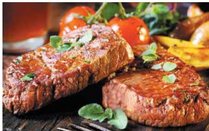
В кафе Mon Plaisir вам предложат стейки разной степени прожарки. Лучше всего их вкус раскрывается в прожарках medium и medium rare.

- Стейки чаще предпочитают мужчины, а чем предлагаете полакомиться прекрасной половине гостей нашего курорта?