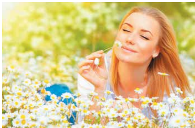
Лазерная очистка крови в комплексе с другими методами лечения помогает навсегда избавиться от аллергии.

После курса процедур нормализуется гормональный фон, работа дыхательной и сердечно-сосудистой систем, улучшается состав крови и ее текучесть. Устраняются различные отеки и воспаления, ускоряются процессы регенерации, восстанавливается иммунитет. Перед проведением курса рекомендую нашим гостям обратиться к врачу ЦКЗ, который назначит индивидуальный курс процедур.